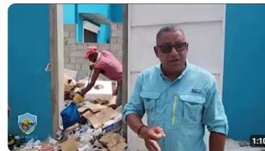
llamado a los propietarios de un reconocido establecimiento comercial 3 visualizaciones • hace 13 días