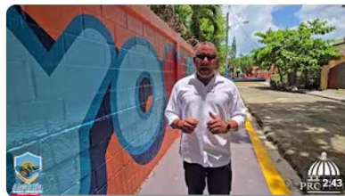
Paseo de los Colores, una obra realizada por PROPEEP gracias a la gestión del alcalde Abelito Suriel 14 visualizaciones • hace 13 días