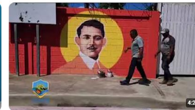
avanza con el remozamiento del parque, la creación de murales y mejoramiento del desagüe 9 visualizaciones • hace 13 días